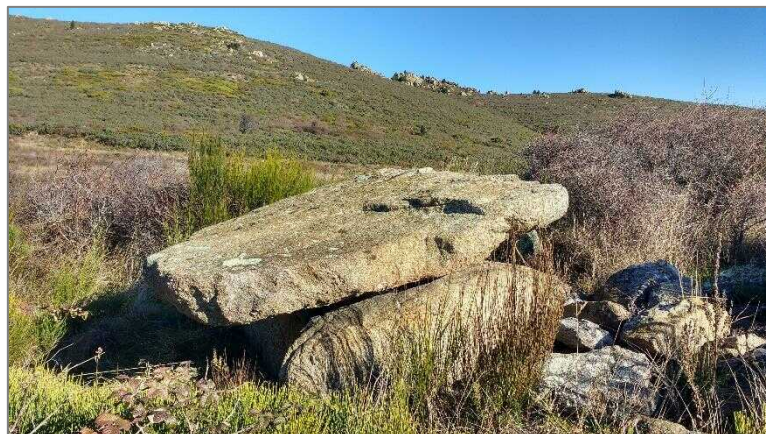
Dolmen Pla de l'Arca